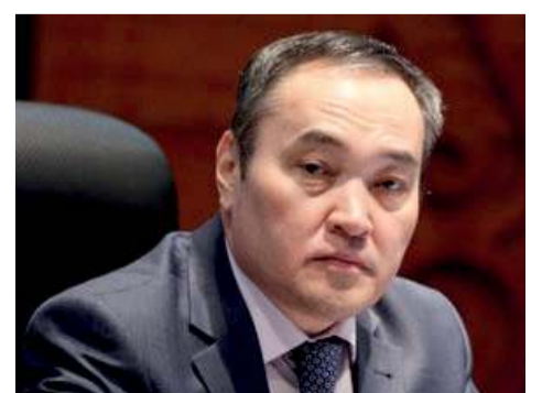
ДАРХАН МЫҚБАЙ, МЕМЛЕКЕТ ЖӘНЕ ҚОҒАМ ҚАЙРАТКЕРІ

Бүгін ақпарат жағынан қорғансыз болу – мемлекет үшін де, жеке адам үшін де қатерлі. Сондықтан еліміздің экономикалық, әлеуметтік, геосаяси, рухани мәртебесін, мүддесін арттыруда, жаңа саяси мәдениет қалыптастыруда отандық БАҚ-тың рөліне ерекше мән беру қажет. Бұл абыройлы миссия журналшылардан үлкен жауапкершілікті талап етеді.