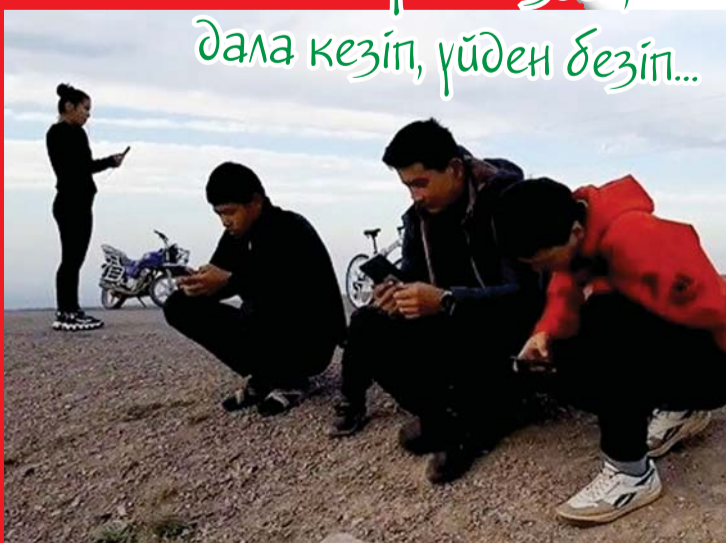
Келебұлақ ауылы Алматы облысы