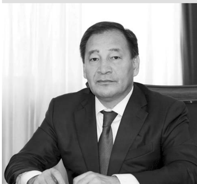
Е.ТОҒЖАНОВ, Қазақстан Республикасы Премьер-Министрінің орынбасары

Пандемия – барша мемлекеттің басына түскен үлкен сын сағатына айналды.